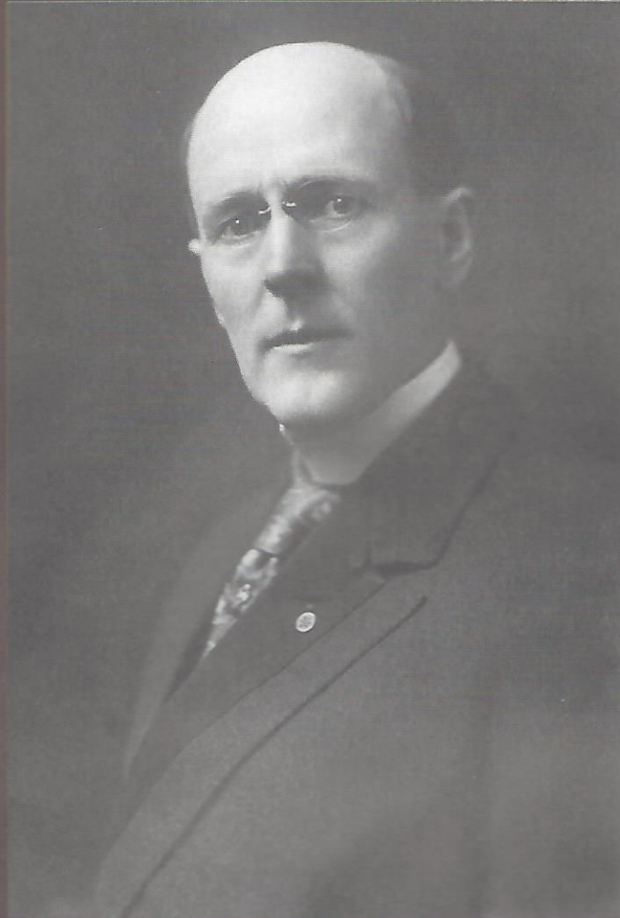
PAUL P. HARRIS

Mange tusen rotarianere yder hvert år eksperthjelp til fattige områder i verden. Et stort nordisk hjelpeprogram under frivilligtjenesten er Den skandinaviske legebanken, som teller 500 nordiske leger og tannleger. Fra en sped begynnelse for femten år siden sender nå Legebanken hvert år ut 150 leger og tannleger til Den tredje verden. Mange av dem gjør tjeneste i områder som aldri har hatt besøk av leger eller tannleger.